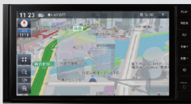
日産オリジナルナビゲーション (MM223D-L)〈ディーラーオプション〉 *画面はハメ込み合成です。