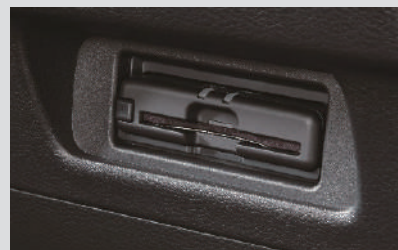
ETC2.0 ユニット (HM19-D2) <ディーラーオプション>