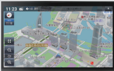
日産オリジナルナビゲーション (MM223D-L) <ディーラーオプション>