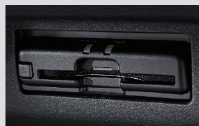
ETC2.0 ユニット (BM19-D2) <ディーラーオプション>