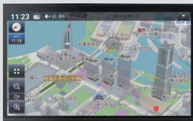
日産オリジナルナビゲーション (MM223D-L) <ディーラーオプション>