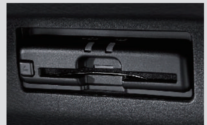
ETC2.0 ユニット (BM19-D2) <ディーラーオプション>