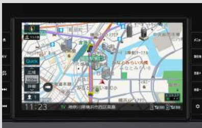
日産オリジナルナビゲーション (MJ323D-L) <ディーラーオプション>