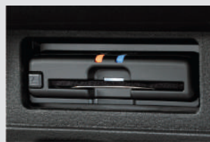
ETC2.0ユニット(BM19-D2) 〈ディーラーオプション〉