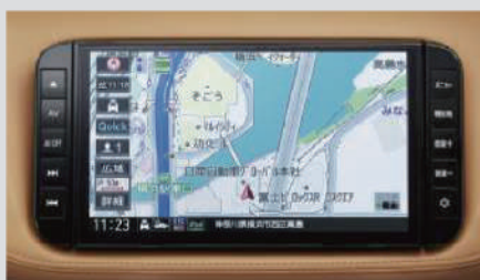
日産オリジナルナビゲーション (MM323D-L) <ディーラーオプション>