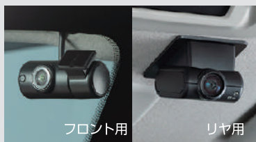
日産オリジナルドライブレコーダー (フロント・リヤ) (DJ6-D) 〈ディーラーオプション〉